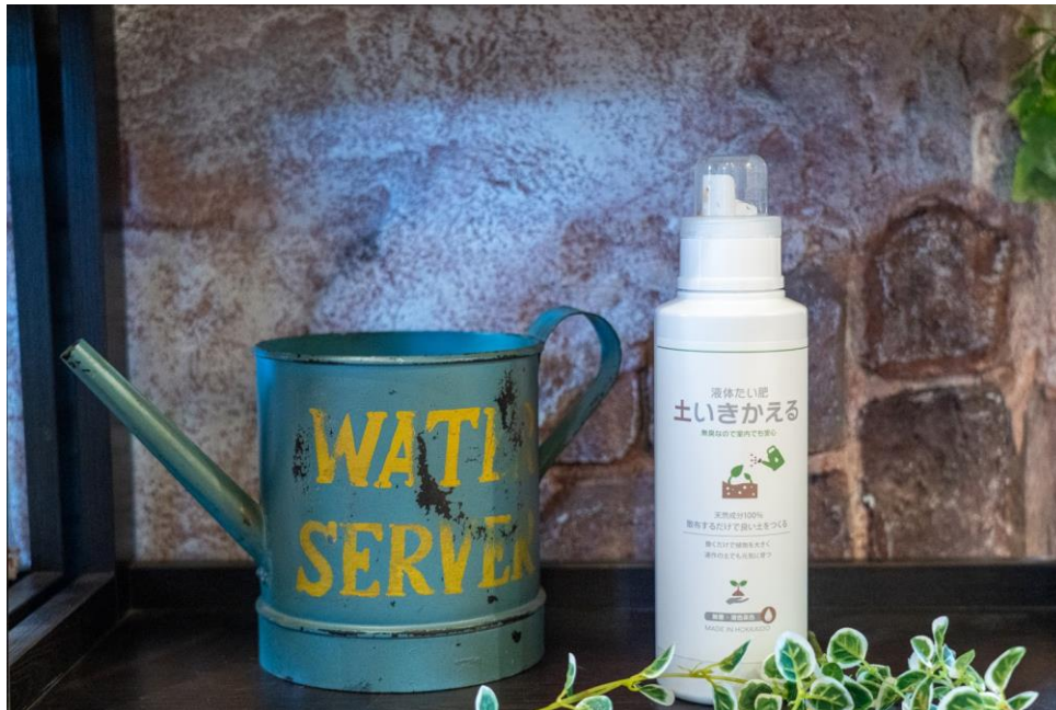
『液体たい肥・土いきかえる』